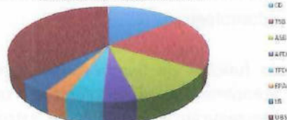
DISTRIBUIÇÃO DAS VISITAS POR CATEGORIA